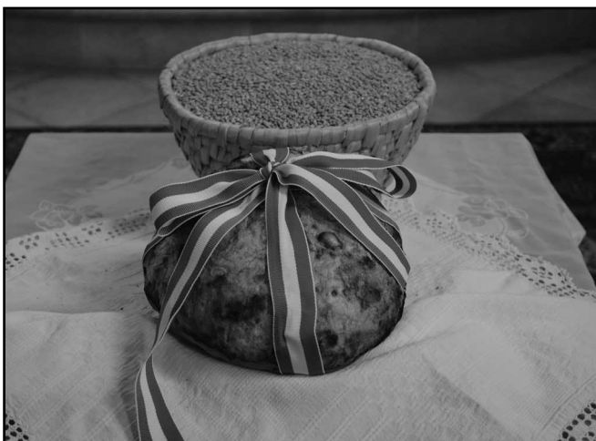
ÚJ KENYÉRÉRT VALÓ HÁLAADÓ ISTENTISZTELET 2015. augusztus 23.