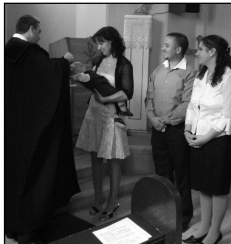
KERESZTELŐ NAGYTARCSÁN 2015. szeptember 30.